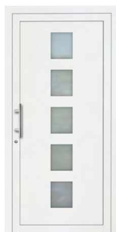
MEHA rahmenlose Glasausschnitte Glas Mattierung „Bonn“ Griff MAIKE, Edelstahl