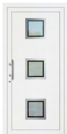
ANDELE Edelstahlrahmen Glas Mattierung „Berlin“ Griff MAIKE, Edelstahl