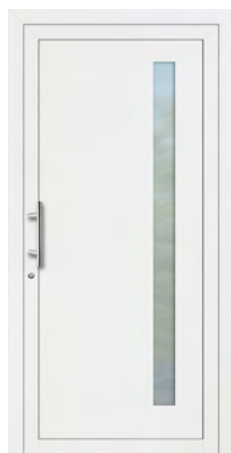
NORI rahmenloser Glasausschnitt Glas Mattierung „Bonn“ Griff MAIKE, Edelstahl