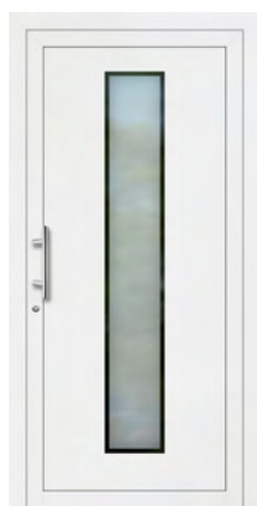
KETIL rahmenloser Glasausschnitt Glas Mattierung „Berlin“ Griff MAIKE, Edelstahl