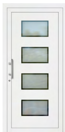
NILDA rahmenlose Glasausschnitte Glas Mattierung „Berlin“ Griff MAIKE, Edelstahl