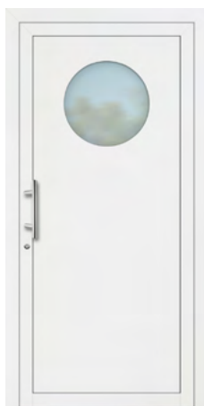
BOMBUR rahmenloser Glasausschnitt Glas Mattierung „Bonn“ Griff MAIKE, Edelstahl