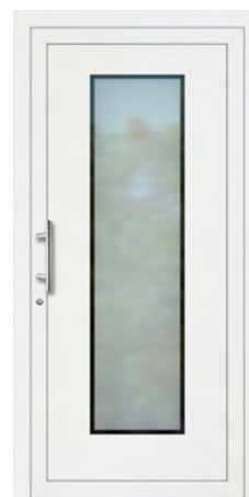
FILI rahmenloser Glasausschnitt Glas Mattierung „Berlin“ Griff MAIKE, Edelstahl