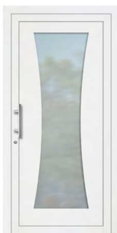
THORIN rahmenloser Glasausschnitt Glas Mattierung „Bonn“ Griff MAIKE, Edelstahl