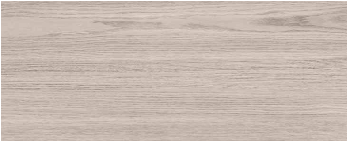
Pure Oak Grey 80003926 1225 x 195 x 8,5 mm