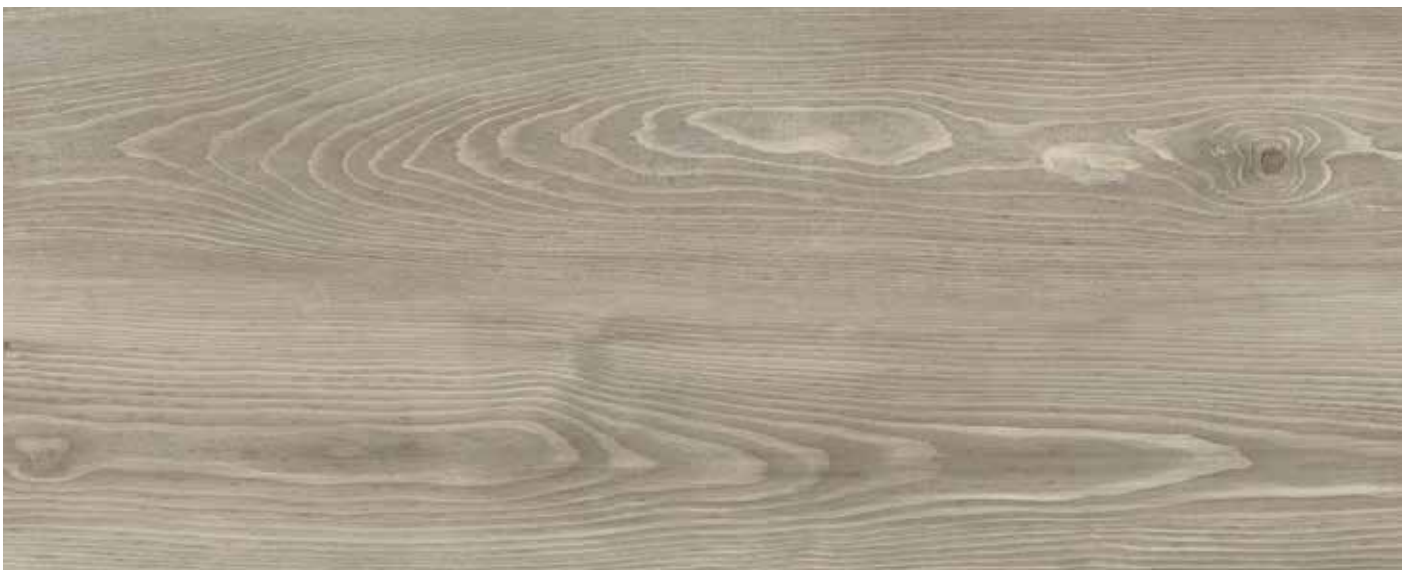
Smoke Oak Grey 80003935 1225 x 195 x 8,5 mm