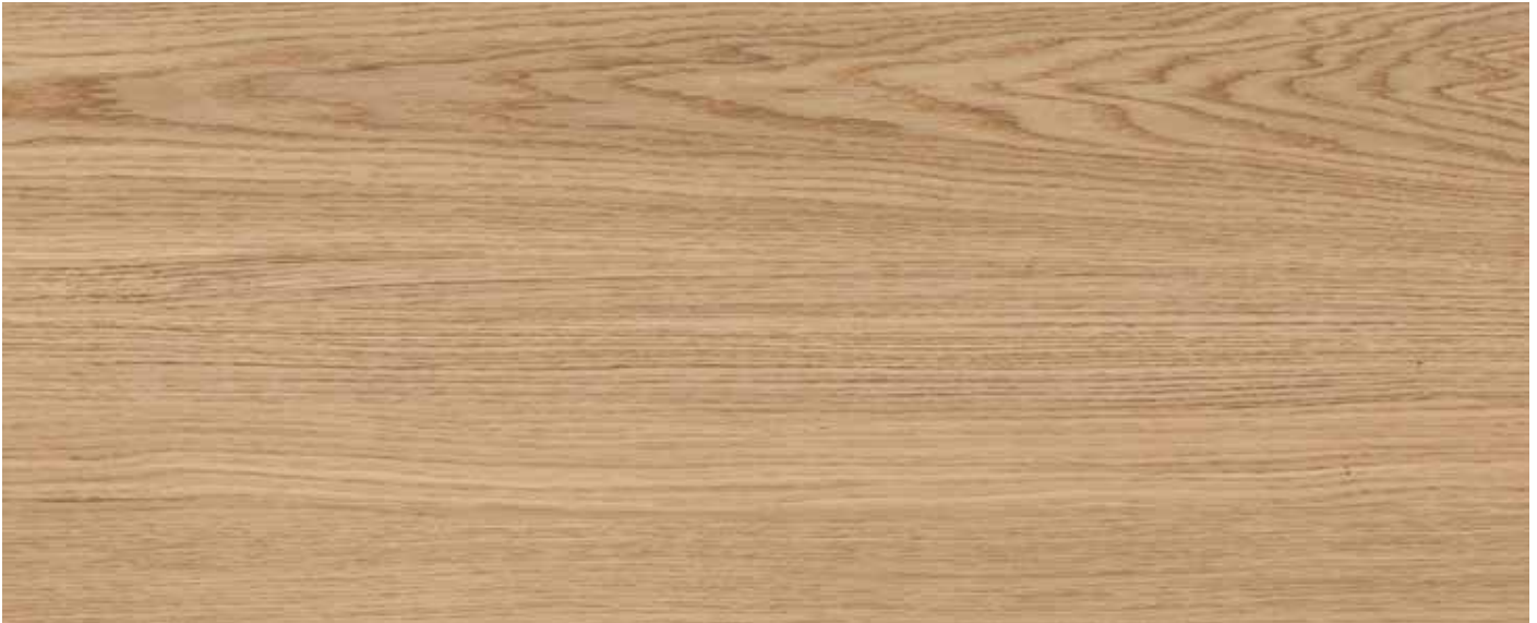
Pure Oak 80003925 1225 x 195 x 8,5 mm