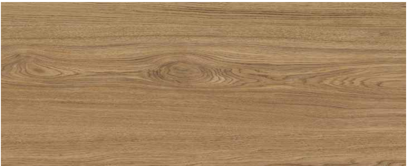
Epoca Oak Dark Almond 80003924 1225 x 195 x 8,5 mm