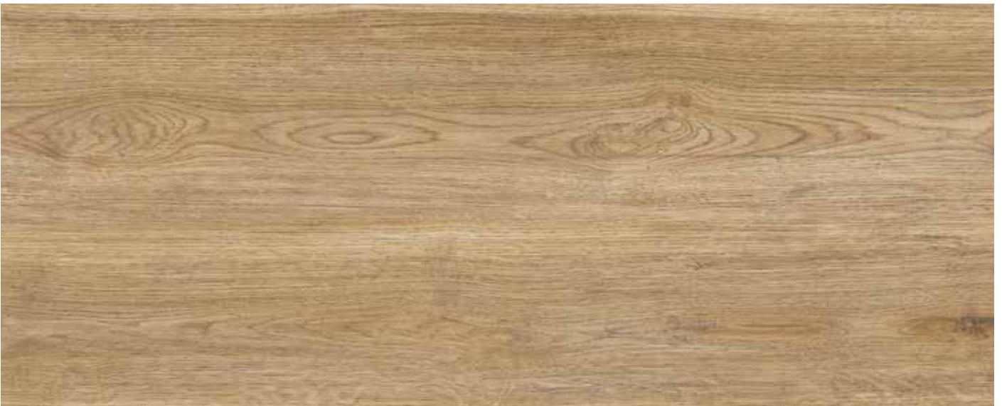
Ariana Oak 80003930 1225 x 195 x 8,5 mm