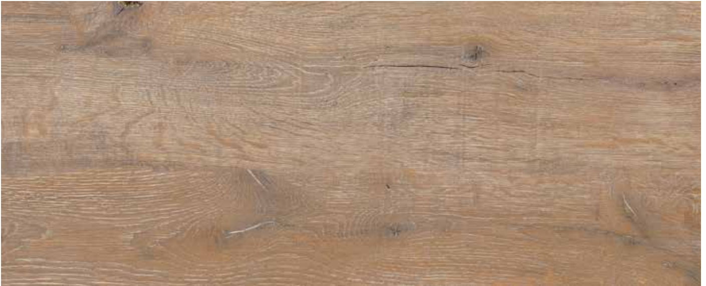
Farina Oak Savannah 80003928 1225 x 195 x 8,5 mm