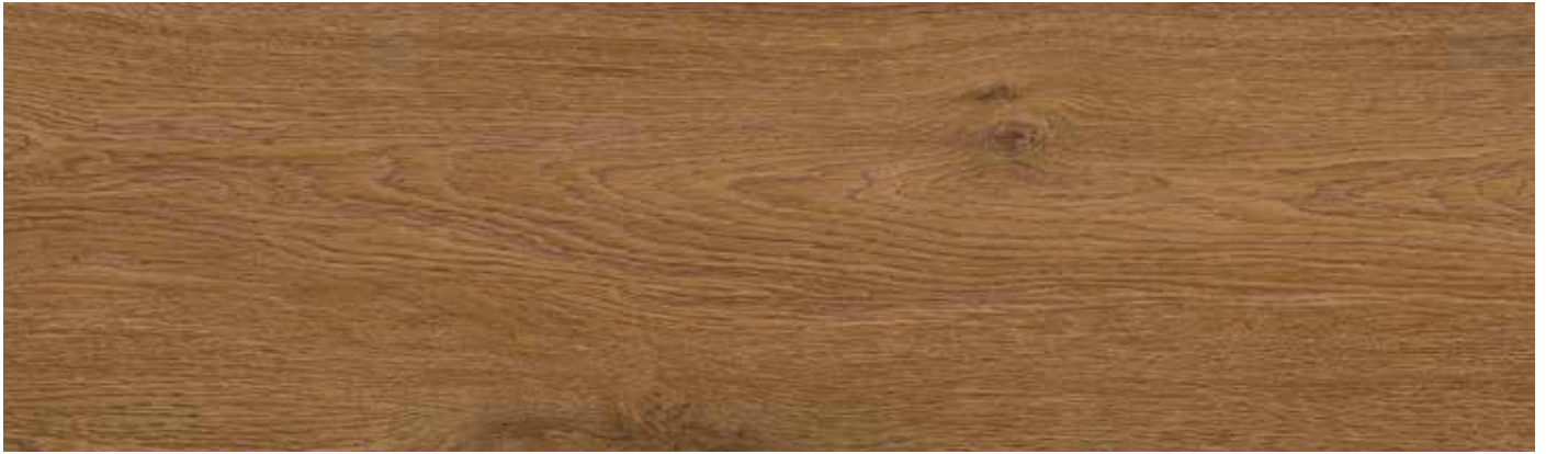
Ginger Wood Camel 80003956 1225 x 195 x 8,5 mm