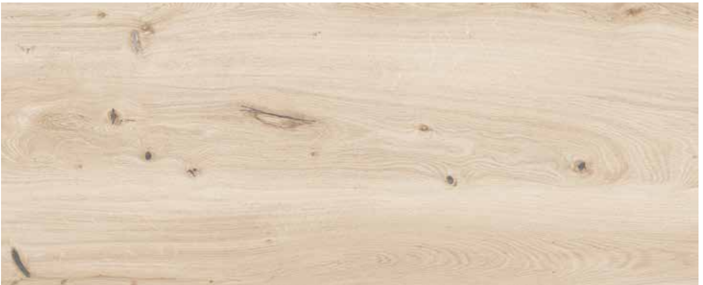
Panama Oak Light Sand 80003943 1225 x 195 x 8,5 mm