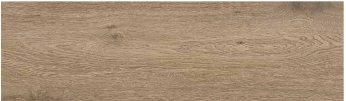
Ginger Wood Fume 80003957 1225 x 195 x 8,5 mm