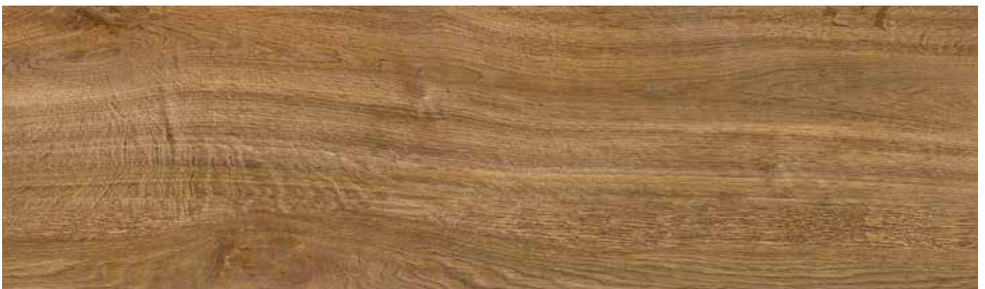
Antique Oak Honey 80003968 1225 x 195 x 8,5 mm