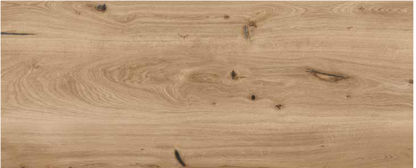
Panama Oak 80003942 1225 x 195 x 8,5 mm