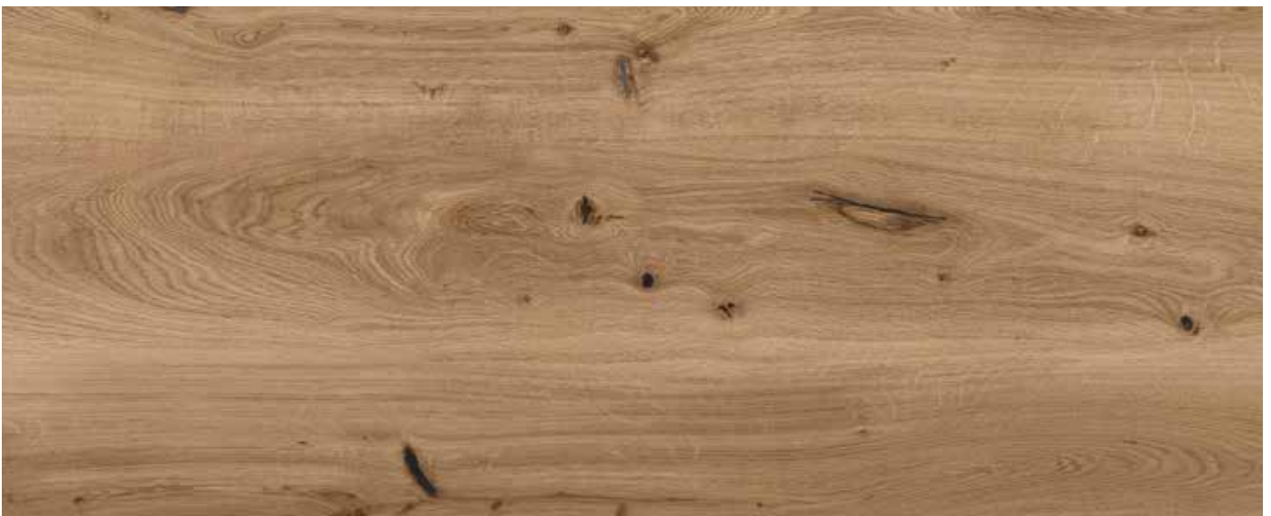
Panama Oak Cognac 80003945 1225 x 195 x 8,5 mm