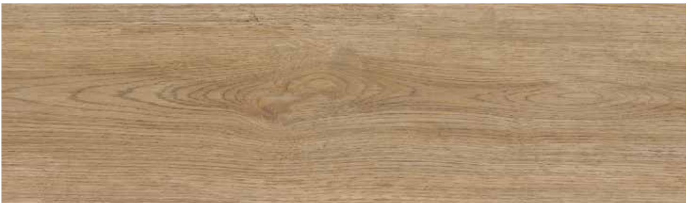
Essential Oak 80003960 1225 x 195 x 8,5 mm